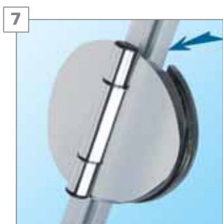
7 zawias - chromowany