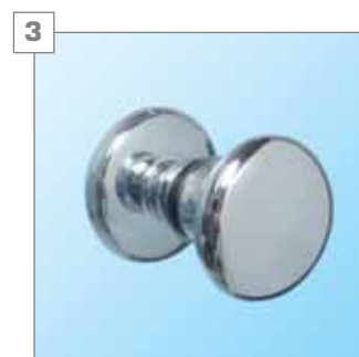
3 uchwyty do drzwi - chromowane