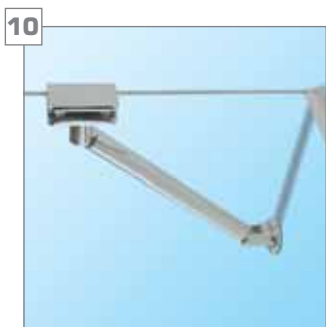
10 wspornik - chromowany