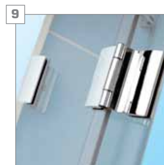
9 zawias i łącznik chromowany