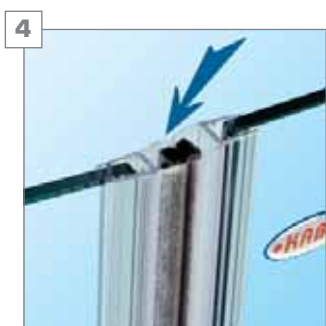
4 uszczelki magnetyczne