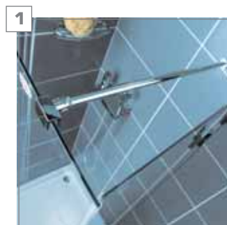
1 wspornik - chromowany