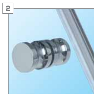
2 uchwyty do drzwi - chromowane