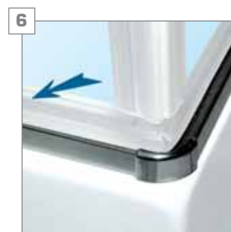
6 listwy progowe - chromowane