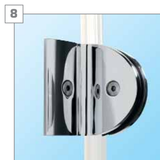
8 łącznik - chromowany