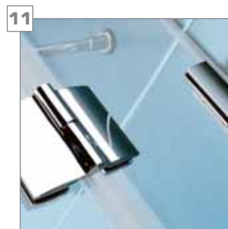
11 zawias i łącznik chromowany